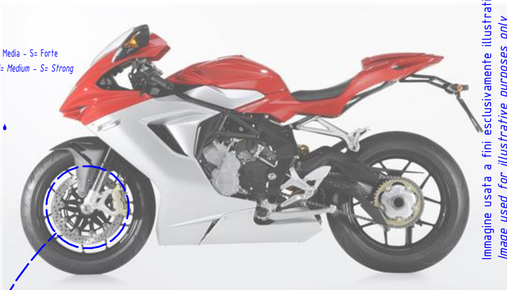
Immagine usata a fini esclusivamente illustrativi Image used for illustrative purposes only

Lubrificare ✓ / Lubricate ✓ Non lubrificare ✗ / Do not lubricate ✗ Solo primi filetti ◆ / First threads only ◆