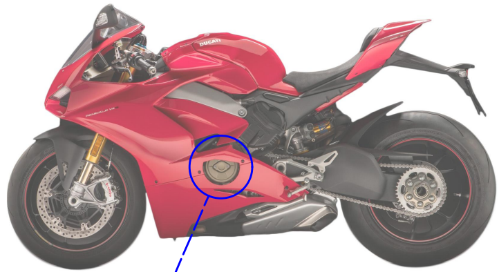
Immagine usata a fini esclusivamente illustrativi Image used for illustrative purposes only

Bloccare con frenafiletto: L= Leggera - M= Media - S= Forte Lock with the threadlocker: L= Light - M= Medium - S= Strong