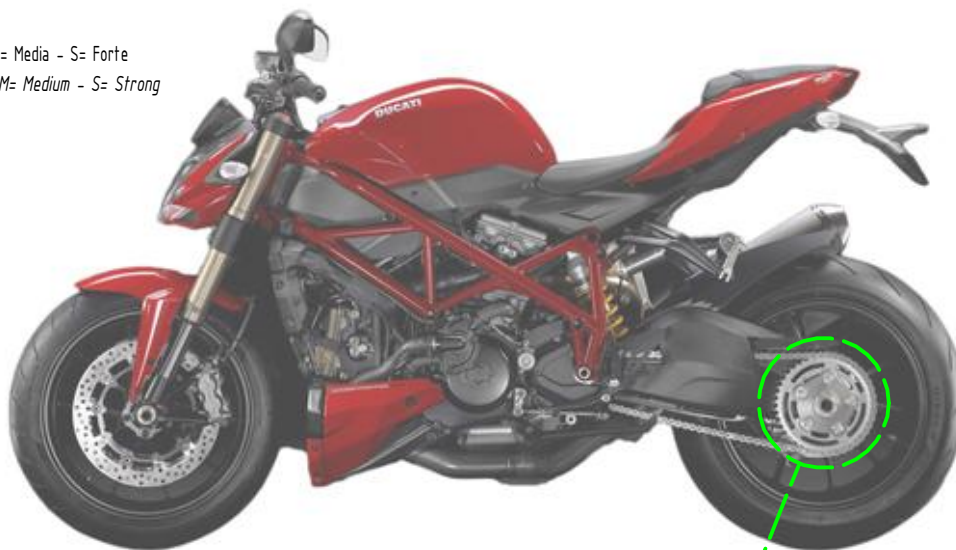
Immagine usata a fini esclusivamente illustrativi Image used for illustrative purposes only