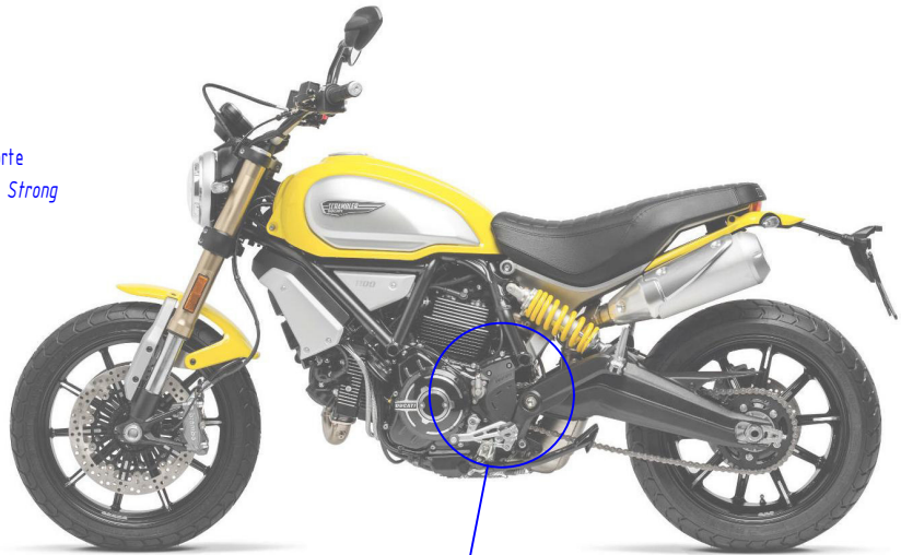
Immagine usata a fini esclusivamente illustrativi Image used for illustrative purposes only

Parte della dotazione originale Original equipment manufacturer's part